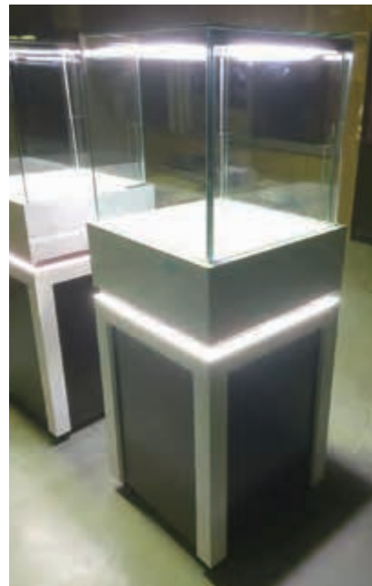
福岡空港の免税店の宝石店のガラスケース